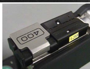
搭配光纖夾具FH-100系列