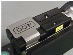
搭配光纖夾具FH-100系列